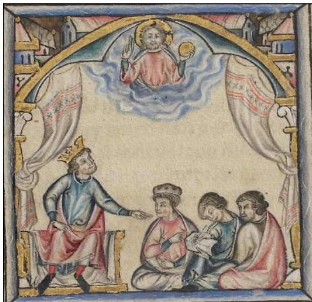
Miniatura del folio 1v del manuscrito Additional 20787 de las British Library, Londres (LBL), Libro del fuero de las leyes .

Esta teoría ha pasado por varias fases de interpretación desde entonces. En 1952, García-Gallo discutió la cronología de la obra legislativa de Alfonso X, defendiendo que la única obra redactada durante su reinado habría sido el Libro del Fuero , conocido como Espéculo , derecho municipal vigente entre 1255 y 1272; mientras que situaba el Fuero de las Leyes , versión arcaica de las Siete Partidas , como una revisión de fines del siglo XIII destinada al conjunto del reino, considerando al Fuero Real como una versión concejil de principios del siglo XIV (García-Gallo de Diego 1952).