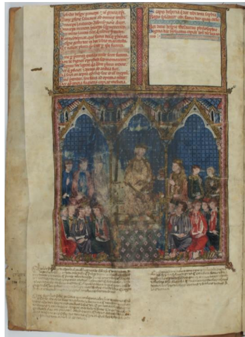
Alfonso X recibe un libro en la corte. ¿Quizás las Siete Partidas ? Frontispicio de la Estoria de España, El Escorial, ms. Y.I.12, fol. 1r